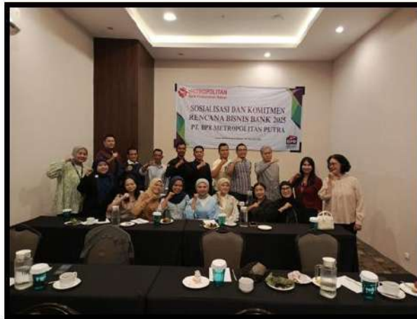
Sosialisasi RBB 2025