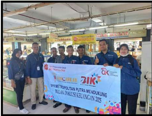
Bulan Inklusi Keuangan tahun 2025