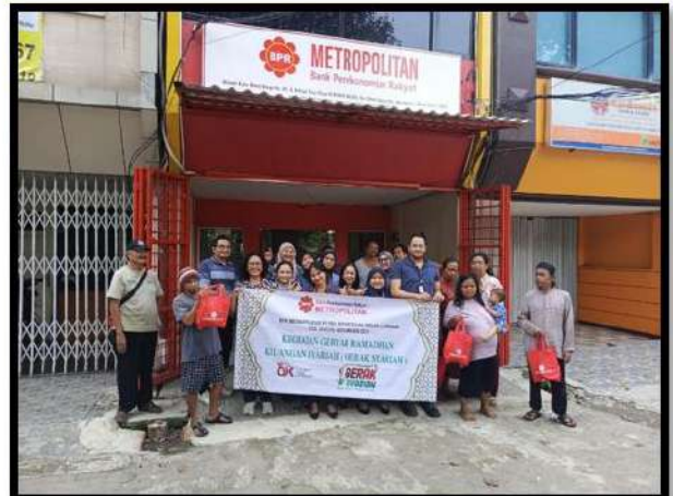
Literasi dan Inklusi Keuangan