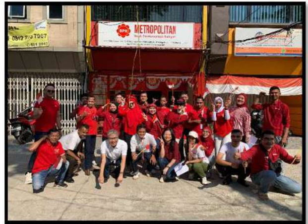
Perayaan HUT RI