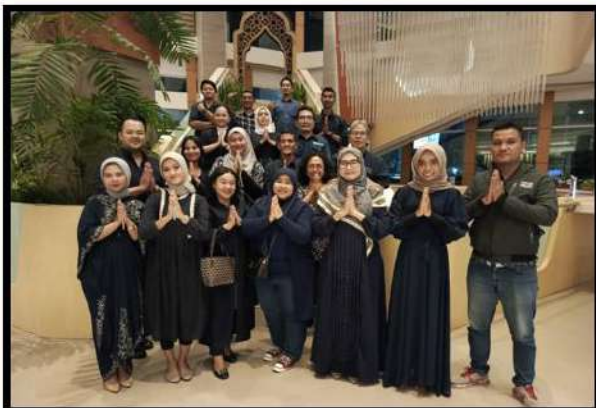
Buka Bersama di bulan Ramadhan